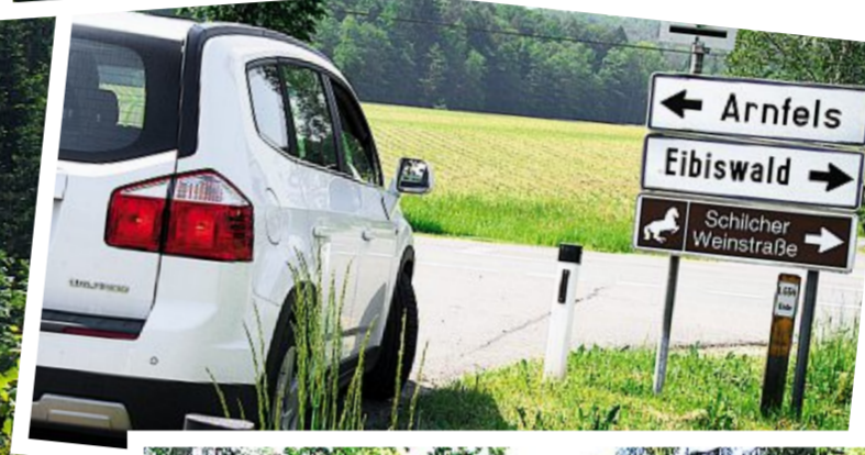
Nicht zu verfehlen: Die gesamte Schilcher-Weinstraße ist sehr gut beschildert