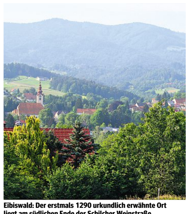
Eibiswald: Der erstmals 1290 urkundlich erwähnte Ort liegt am südlichen Ende der Schilcher Weinstraße