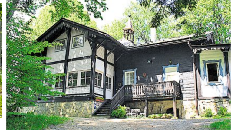
Trahütten: Idyllische Sommerresidenz des Komponisten Alban Berg

Routen für Genießer. Durch das „Steirische Himmelreich“ – eine entspannende Tour durch die westliche Südsteiermark über die Schilcherstraße mit Ausgangs- und Endpunkt im beschaulichen Eibiswald.