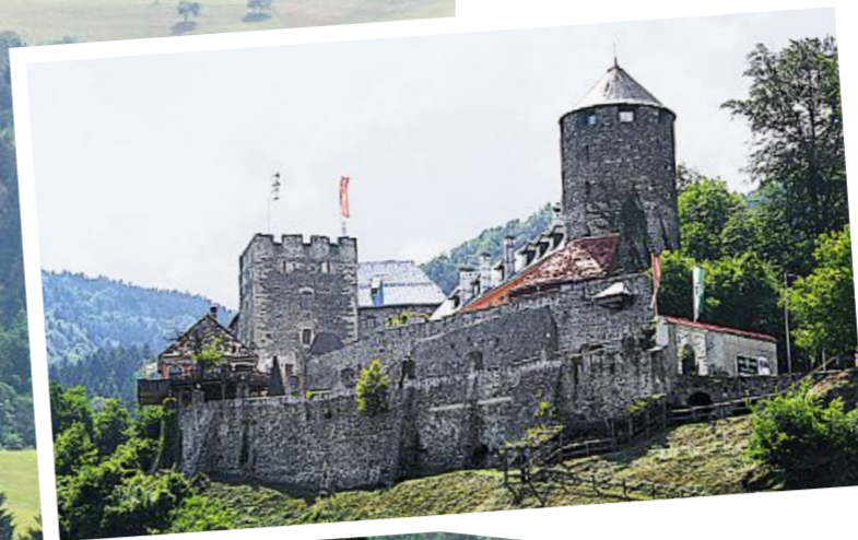
Imposant: Burg Deutschlandsberg mit Hotel, Restaurant und dem Burgmuseum Archeo Norico