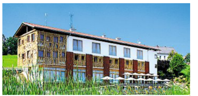
Gediegen und noch ganz neu: Hotel Iwein in Eibiswald

Routen für Genießer Alle Teile der Serie zum Nachlesen gesammelt KURIER.at/geniesserrouten