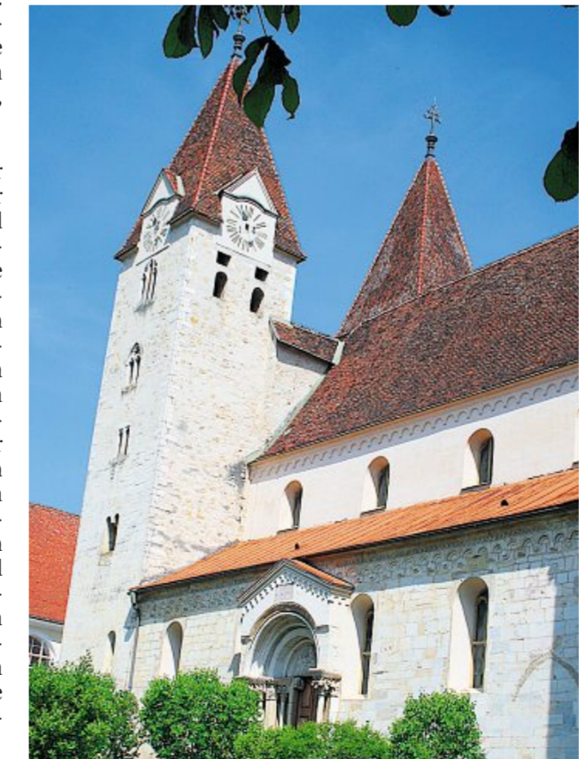
St. Paul im Lavanttal: Die 1264 geweihte Stiftskirche beherbergt Grabstätten von insgesamt 14 Habsburgern